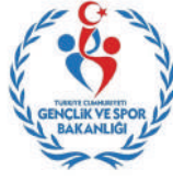
Gençlik ve Spor Bakanlığı